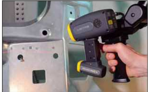
Cyfrowy skaner ModelMaker MMDx100

Dzięki technologii ESP3, skaner ModelMaker jest zdolny do skanowania boków na wypukłych częściach, które często są generatorem różnych refleksów zbieranych przez skanery