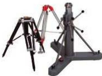
Lekki przenośny lub ciężki przemysłowy trójnóg do mocowania w podłodze

Modułowy system przyłącza bazy i sondy, jak również rozszerzenia zakresu pomiarowego oferuje możliwość zastosowania wielu akcesoriów w celu zwiększenia możliwości wykorzystania w rozmaitych warunkach