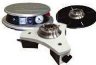
Magnetyczne, przysawkoowe lub śrubowe mocowanie stołu lub narzędzi