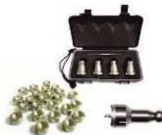
Rozwiązania do rozszerzenia zakresu pomiarowego i sondy